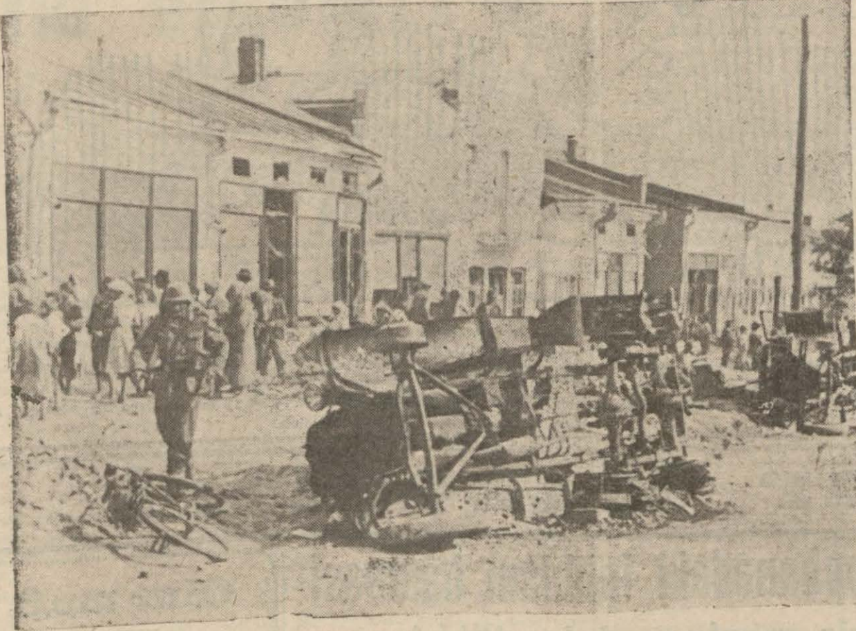
Besarabiyada Almanlar tarafından işgal edilen bir Sovyet şehrinin hali

Ankara 6 (Hususî) — Artırma, eksiltme ve ihale kanununa bir muvakkat madde eklenmesi hakkında kanun meclisi Meclis umumî heyetine sevk edilmiştir. Maliye endüveni nazırı Meclisinde ezimle şöyle demektedir: "Memleketimize ihale olunması zarurî bulunan bazı esya ve malzemenin temini yeni cihan harbinin şunul dairisini genişletmiş olmasından dolayı bir iki piyasaya inhisar etmiş ve bunlar da diğer memleketlerden vaki mütemadi talepler karşısında ihzar, tediyeye ve teslim şartlarını kendi hususî vaziyetlerinin tecrübelerine göre tayin etmeye başlamışlardır. Bu hal müvafıklaştırılmadık takdirde zikrolunan artırma, eksiltme kanunu ile umumî muhasebe kanununun teminat hakkındaki hükümlerine riayet olunmak kaydı ile mal satılmak imkânı kalmamıştır." Encümenimiz 1939 harbinin devamına ve artırma, eksiltme kanununu umumî muhasebe kanununun hükümlerini tabii kabul olmanın halhale muhtasar olmak şartı ile hükümetin istimal salâhiyetleri vermesi istihbaratından lâzımları aynen ve müteffaklaştırarak kabul etmiştir.