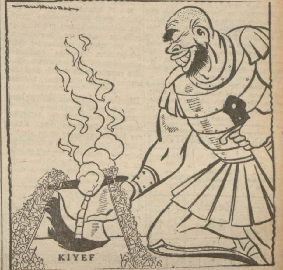
Harb — Şu Kiyefin keyfine doyum olmuyor!